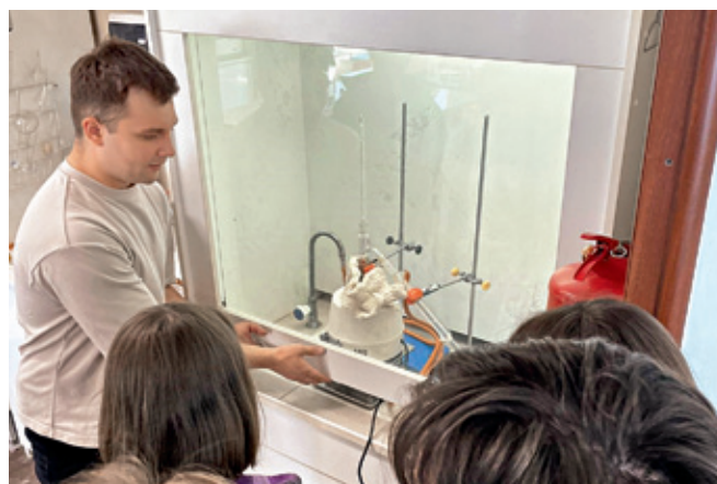
Рис.1. Во время проведения семинаров и практических мастер-классов

Идея академических классов состоит в том, чтобы школьники могли попробовать себя в работе в реальных лабораториях академических институтов и подготовились к выполнению своих профессиональных задач, в том числе и как будущие химики. Старшеклассники на современном оборудовании проводят первые научные исследования. Лаборатория при этом служит инструментом познания естественно-научных процессов, где владение современными технологиями – один из основных навыков.