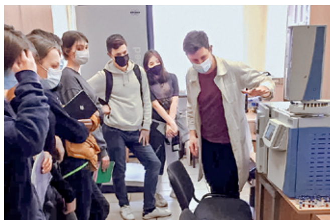
Рис.2. Экскурсии для школьников в лабораториях института